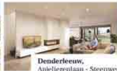
Denderleeuw, Anjellerenlaan - Steenweg

Twee moderne woningen met strakke lijnen, tijdloze materialen en grote glaspartijen. Onze architecten zorgden voor open leefruimtes met veel lichtinval, voldoende opbergmogelijkheden, een inpandige garage, 3 slaapkamers en een dressing.